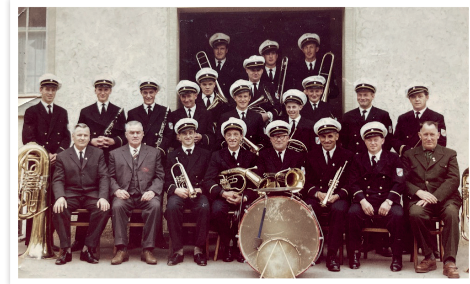
Gruppenbild des Musikvereins aus dem Jahr 1960