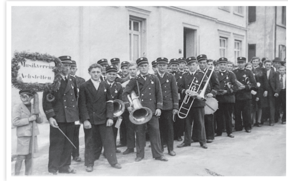
Gruppenbild des Musikvereins aus dem Jahr 1948