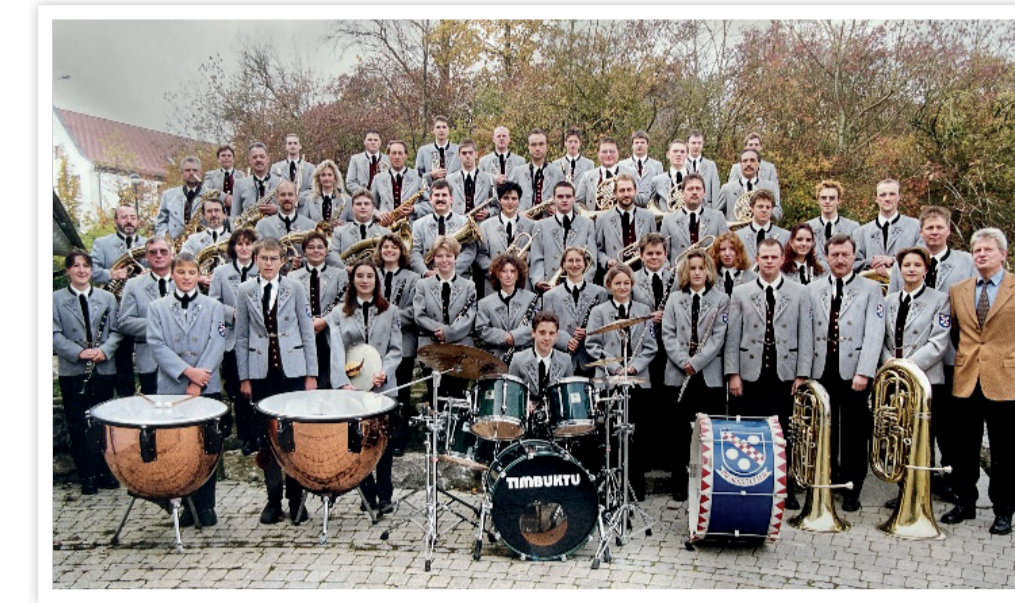
Gruppenbild des Musikvereins aus dem Jahr 1999 in alter Uniform

Nach nur neun Monaten Bauzeit und 6000 ehrenamtlich geleisteten Arbeitsstunden kann das neue Probeheim eingeweiht werden.