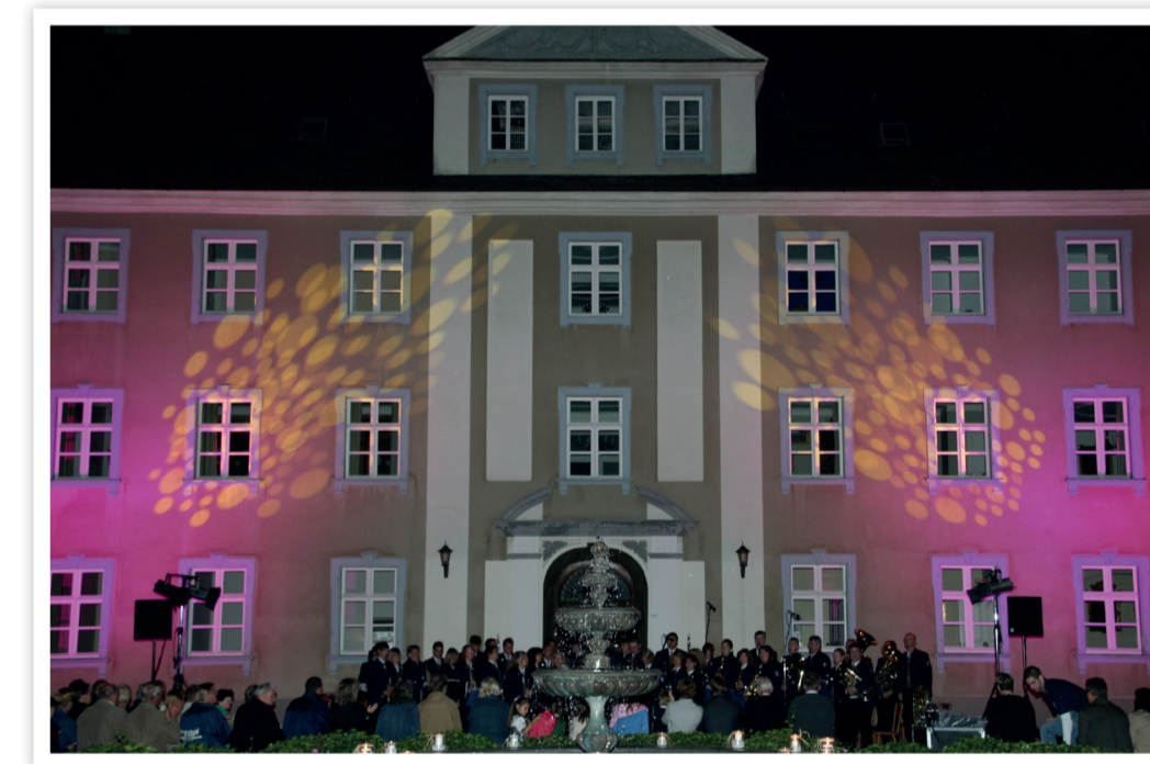
Traditionelle Serenade im Schlosshof Achstetten