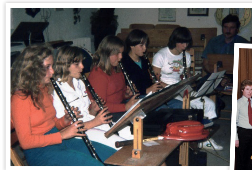
Registerprobe im Dachgeschoss der Achstetter Schule als ursprünglicher Proberaum.

Neben der musikalischen Ausbildung von Jungen werden nun erstmals auch Mädchen (in den Instrumenten Klarinette und Flöte) unterrichtet.