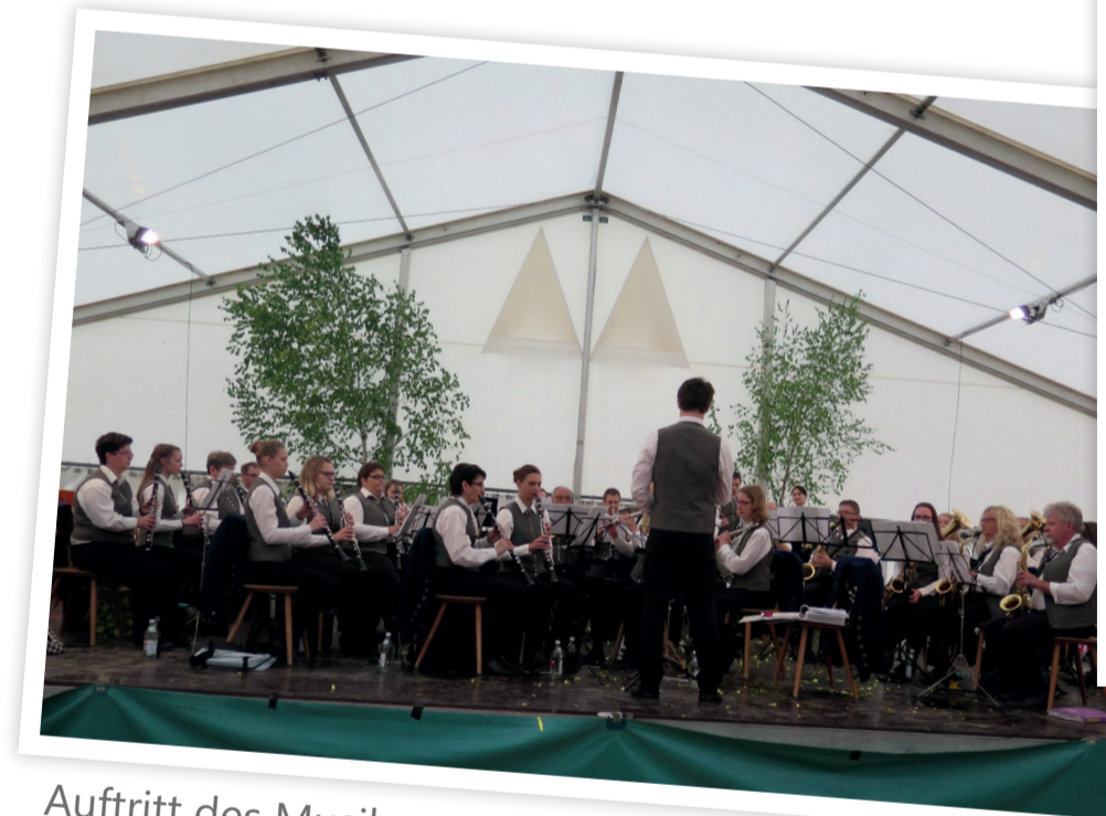
Auftritt des Musikvereins beim traditionellen Achstetter Maifest