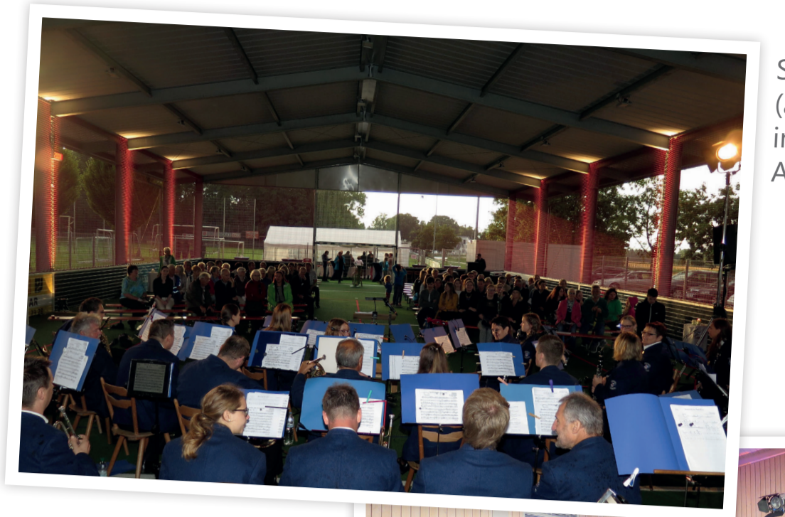
Serenade 2016 (aufgrund Regen in der Sportarena Achstetten)

Trotz mehrerer Dirigentenwechsel wurden die Traditionen des Musikvereins stets gepflegt, wie z. B. das Frühjahrskonzert in der Georg-Seif-Halle in Achstetten, die Serenade im Schlosshof, das Kirchenkonzert in der Kirche St. Oswald sowie Auftritte beim Kinder- und Heimatfest in Laupheim.