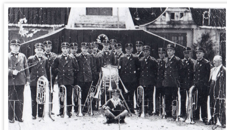
Gruppenbild des Musikvereins aus dem Jahr 1938