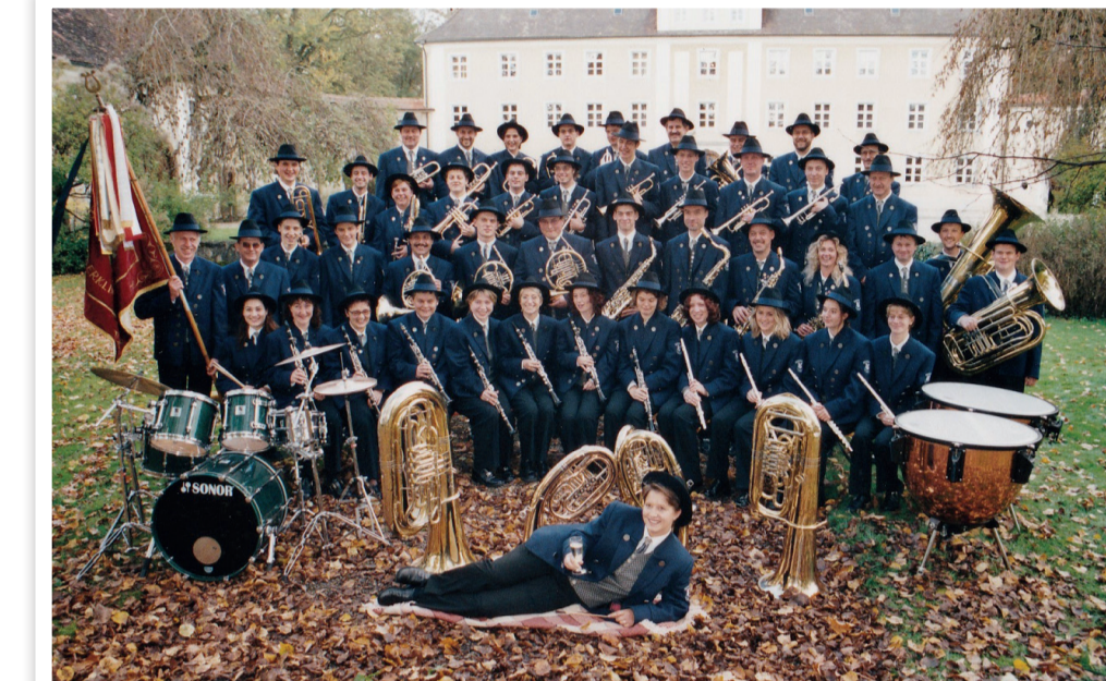
Gruppenbild des Musikvereins aus dem Jahr 2001 in neuer Uniform